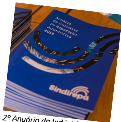
2º Anuário da Indústria de Reparação Automotiva 2019