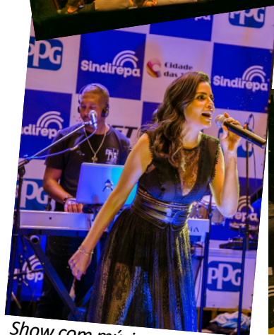
Show com música ao vivo