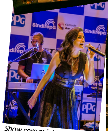
Show com música ao vivo