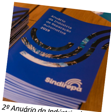
2º Anuário da Indústria de Reparação Automotiva 2019