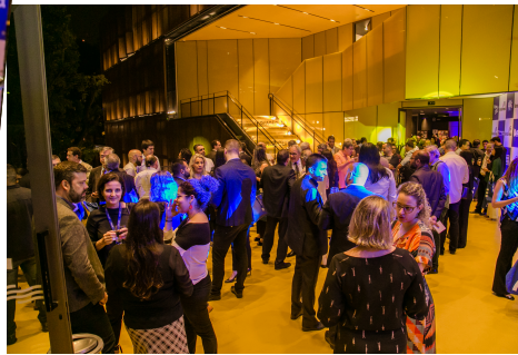
Coquetel – Melhores do Ano 2019