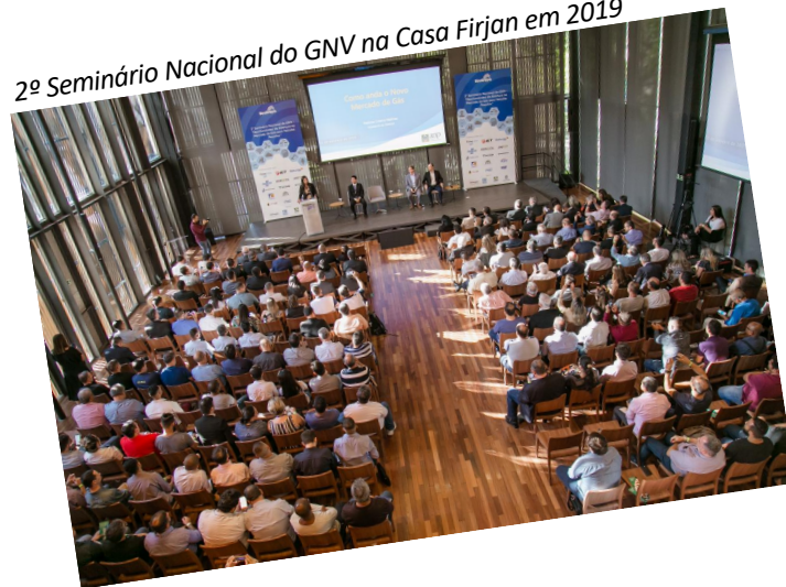
2º Seminário Nacional do GNV na Casa Firjan em 2019