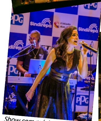
Show com música ao vivo