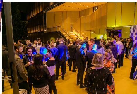
Coquetel – Melhores do Ano 2019