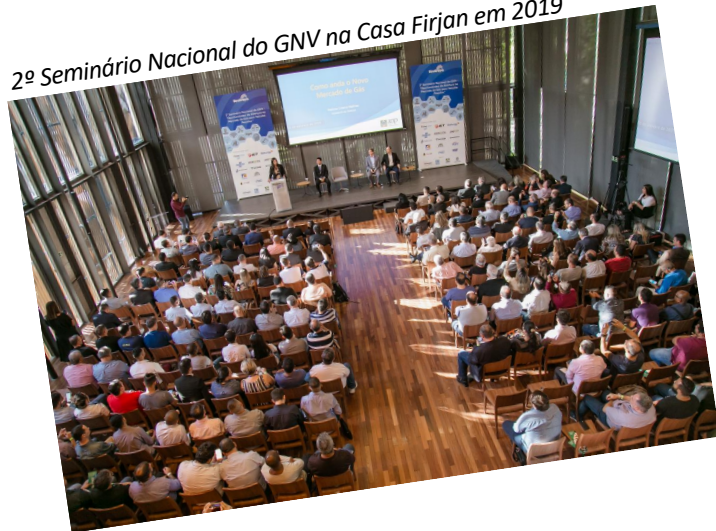
2º Seminário Nacional do GNV na Casa Firjan em 2019