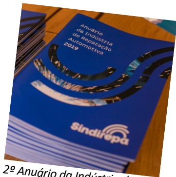
2º Anuário da Indústria de Reparação Automotiva 2019