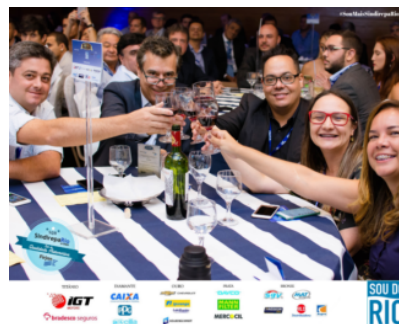
3º Edição – Os Melhores do Ano 2018